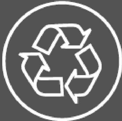
Centre de tri