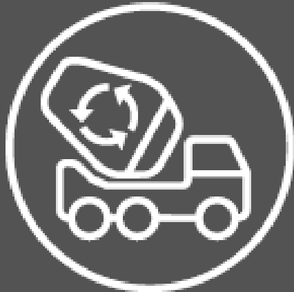
Recyclage du béton