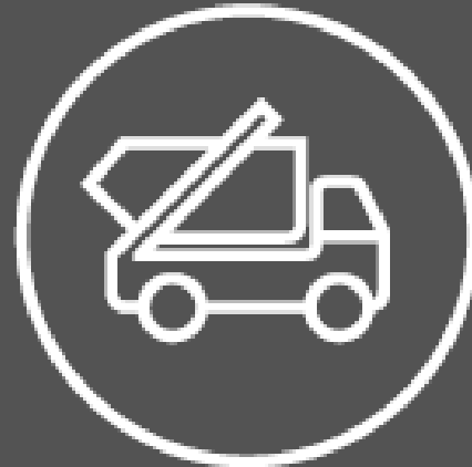
Collecte de déchets